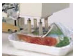
フレキシブル シリンダー